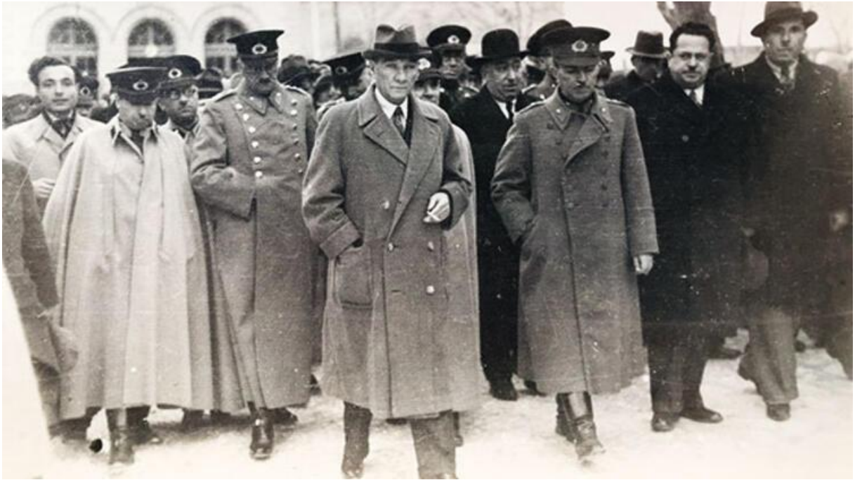
Modern Türkiye Cumhuriyeti'nin kurucusu Gazi Mustafa Kemal ATATÜRK.

Birleşik Devletler, hoşgörü ve dinler arası diyaloga katkı sağlayabilmeleri maksadıyla Müslüman ülkelerdeki hükümetleri barışçıl Müslüman organizasyonlara izin vermeye teşvik ederek bu karşı ideolojinin gelişmesine yardım edebilir. Birleşik Devletler bunun yanı sıra Müslüman dünyasındaki işletmeleri çeşitliliği, hoşgörüyü ve yurttaşlık eğitimini teşvik eden faaliyetleri finanse etmeleri yönünde teşvik edebilir. Bunun da ötesinde Müslüman ülkelere, eleştirel düşüncüyü, vatanseverlik duygularını, ahlakı ve İslam’ın demokrasi ve laiklikle uyumlu değerlerini öne çıkaran okul eğitim programları geliştirmelerinde yardım edebilir.