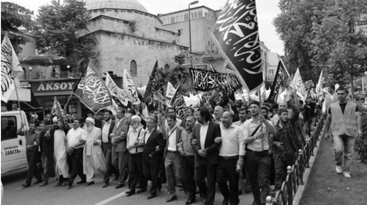
Hizb-ut Tahrir'in 2015 yılında İstanbul'un Fatih semtinde düzenlediği bir yürüyüş.

Mekke ve Medine kentlerinden sonra, Kudüs kentinde bulunan İslam dininin en kutsal yeri olan Al-Aqsa ve Dome of the Rock Mosque (Kubbetüs Sahra) camilerini ziyaret eden bütün yabancı ziyaretçilere, Amerika'da doğan eski bir Yahudi subayının Nisan 1982'de açtığı mermi delikleri rutin bir şekilde gösterilmektedir. ix Daha birçok nesil Müslüman'a; İslam dinine inananlara, yapılanların terörizmi ezmekten ziyade, bizzat İslam'ın kendisine saldırı olduğunu sembolize eden, Irak ve İsrail'de mabetler ve kutsal yerlere verilen zararlar gösterilmeye devam edilecektir.