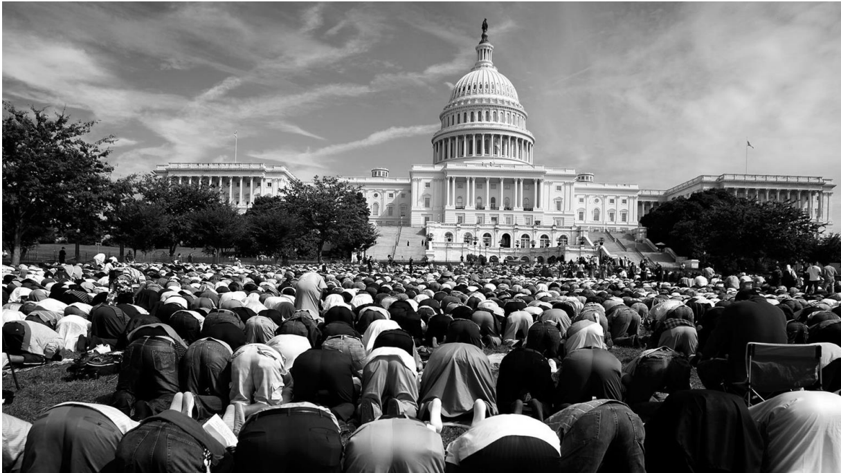
“Islam Capitol Hill 2009” etkinliğine katılan Müslümanlar namaz kılarırken. 25 Eylül 2009, Washington, DC.

Hizb ut-Tahrir örgütünün ABD düşmanlığı yüzeysel emperyalizm iddialarından çok daha derindir. Hizb ut-Tahrir örgütü Amerika Birleşik Devletlerini, öncelikle “İslam Cemaatinde” bir halifelik kurmak ve ardından da egemenlik alanını kademeli olarak genişleterek dünyayı fethetmek hedefinin önündeki en büyük engel olarak görmektedir. Hizb ut-Tahrir, kendi çıkarları ile Amerikan çıkarlarının çelişkili olduğunu kabul etmekte ve ABD küresel egemenliğini sona erdirmeyi en önemli hedefi olarak görmektedir. xxii