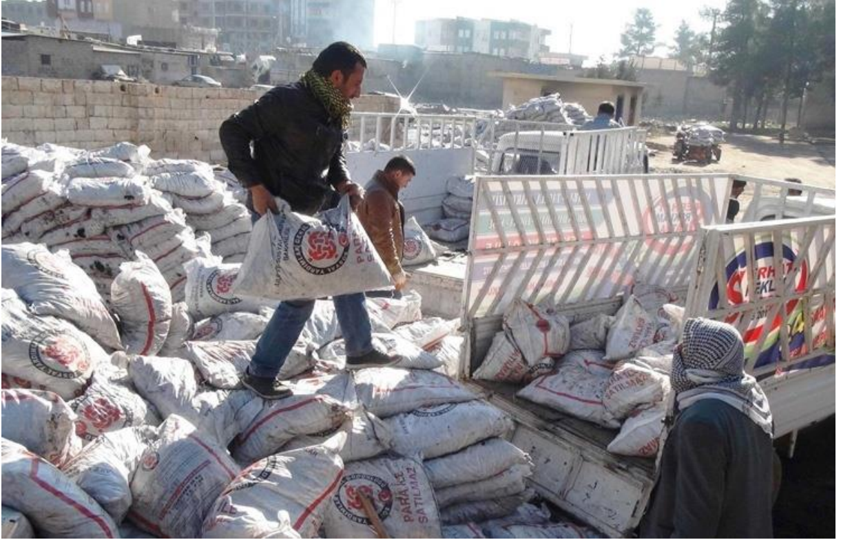
Üzerinde PARAYLA SATILAMAZ yazılı yardım çuvalları.

AKP'nin liberal ve serbest Pazar ekonomi politikaları da sosyal olarak muhafazakâr, fakat küresel ekonomiye entegre olmuş taşralı girişimcileri cezbetmiştir. AKP'nin demokratik reformlara verdiği destek ve azınlıklara yönelik hoşgörülü politikası, azınlık grupları üyelerinin birçoğunun desteğini almasını da sağlamıştır.