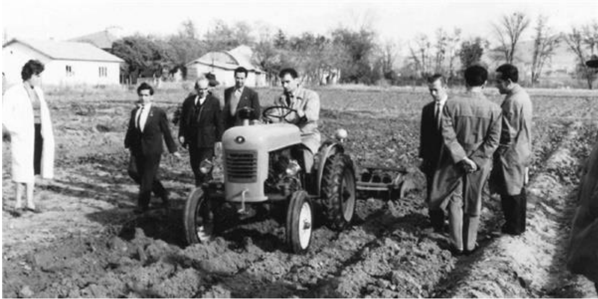
Türkiye'de üretilen ilk traktör.

Ayrıca verilen borç karşılığında ABD'nin istekleri olan tarımda makineleşme dolayısıyla dış ticaret ve yabancı sermaye girişini serbestleştirme ve bu alandaki engelleri kaldırma şartı getirilmişti. 1950 senesinden başlanarak Türkiye bu kalkınma stratejisini kabul etti ve Marshall yardımını aldı. Yardım çerçevesinde hızlı bir traktörleşme ve ABD'nin Vietnam da kullandığı eski araçlara yönelim başladı. Ülkemiz üretim girdileri çerçevesinde ülkemize traktör alımı dayatılırken, İtalya'da traktör fabrikası kurulması sağlanıyor, dışa bağımlı tarım ülkesi rolünü Türkiye üstleniyordu.