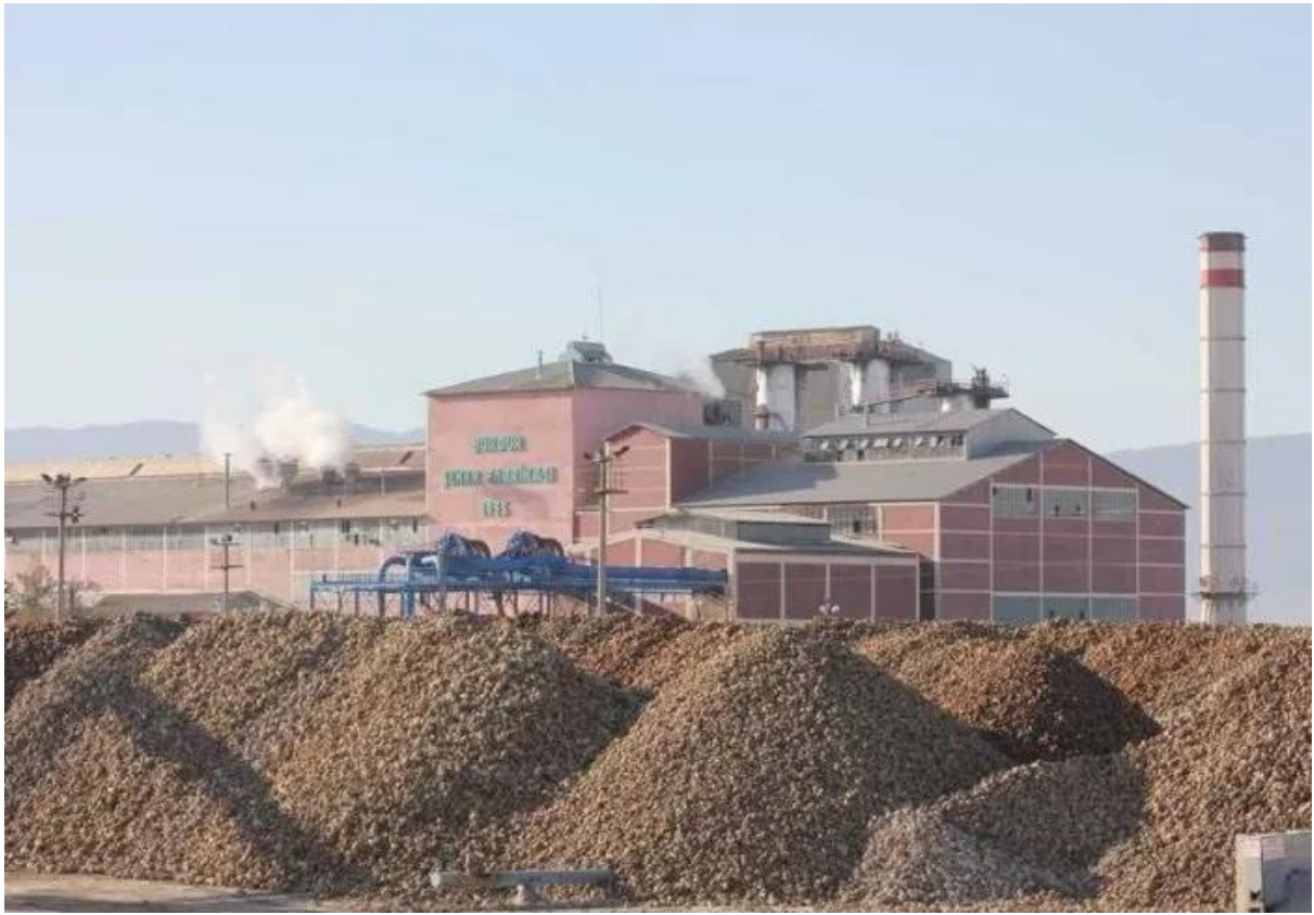
Satılmaları gündemde olan şeker fabrikaları.

Türkiye sahip olduğu iklim ve toprak özellikleri nedeniyle bir çok ürünü planlı yapılanma ile üretebilir ve gerektiğinde ithal yoluna gidebilir. Bugünden yarını ön görerek, ülkemizin krizin nedenlerini ve sonuçlarını iyi analiz etmesi ve olası gelişmeleri de hesaplayarak geleceğe hazırlıksız yakalanmaması gerekir. Öngörümüz önümüzdeki dönemlerde tarım yeniden birincil sektör konumuna geleceği yönündedir. Ülkemizin tarıma yeniden önem vermek ve 70 milyonluk nüfusunu dışa bağımlıktan kurtarmak zorundadır. Bunun için toplumun bilinçlendirilmesi, kendi iç enerjisini doğru değerlendirmesi ve yönlendirmesi gerekmektedir.