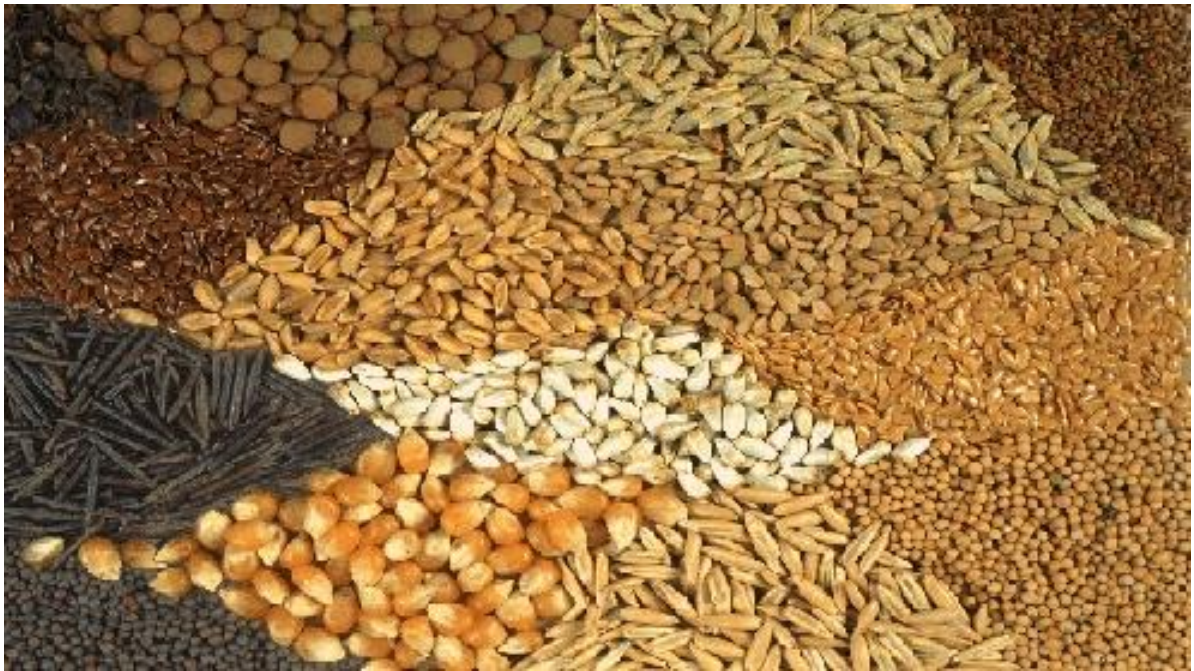
İsrail’den tohum alıyoruz.

Tarımda 15+ yaş istihdamı 1976’da 8.479 milyon kişi iken, 1997’de 8.837 milyon kişiye yükselmiştir (yıllık ortalama artış hızı %0,3). Kabaca, bu dönemde tarım sektörünün istihdam artışı sağlama kapasitesinin fiilen sona erdiğini söyleyebiliriz. Tarım-dışı kesimlerde ise, istihdam 1976’da 6.286 milyondan 1997’de 12.368 milyon kişiye çıkmıştır (yıllık ortalama artış hızı yaklaşık %3,3). Buna göre, uzun dönemde istihdamın gelir esnekliği tarımda 0.29, sanayide 0.53, hizmetlerde 0.78, tarım dışında 0.69, ekonominin tümü için 0,44 olarak hesaplanmaktadır. 93