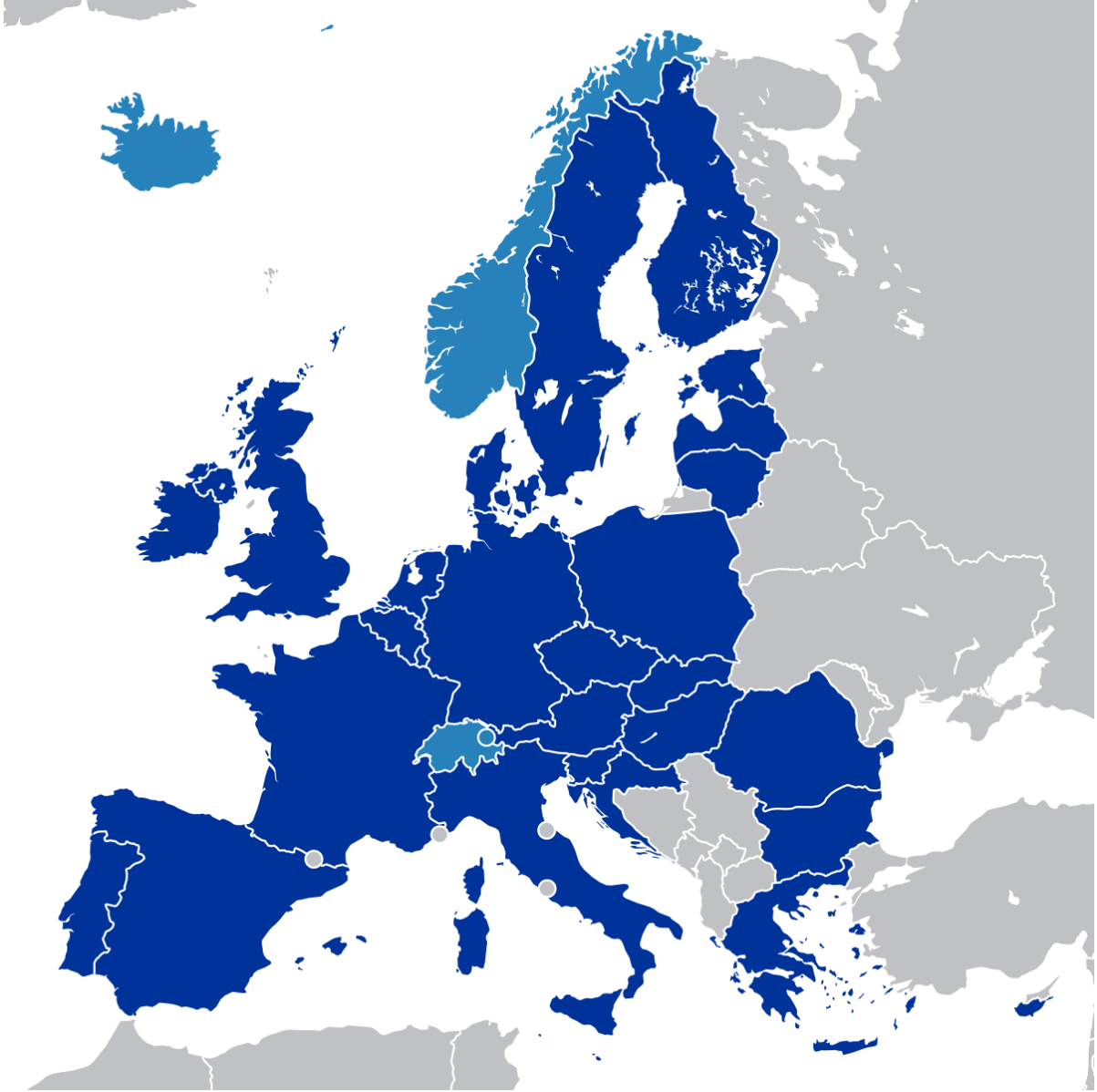
Tek Avrupa. Harita: Bankingtech.com

Avrupa Birliđinin (AB) kuruluşundan günümüze uyguladıđı tarım politikası; amaçları, ilkeleri, uygulama araçları, üretici ve tüketiciye getirdikleri açılardan ayrıntılı olarak incelenecektir. AB'nin "Tek Pazar, Topluluk Tercih ve Mali Dayanışma" ilkeleri incelenerek AB bünyesinde tarımı geliştirmek maksadıyla aldıđı ve uyguladıđı tedbirler ve yaklaşımlar anlatılacaktır.