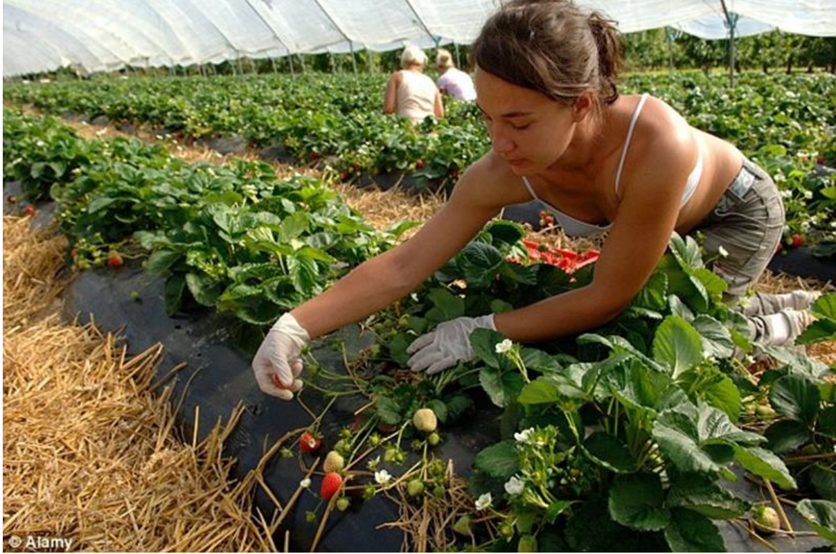
İngiltere’de çilek hasadı.

üye ülkeler arasında serbest dolaşımı sağlanmış ancak bu, tek pazarın oluşması için yeterli olmamıştır. 1999 yılında itibaren Euro'nun kullanılmaya başlanması ile döviz kuru dalgalanmaları sona ermiş, bu da tarım ürünleri tek pazarın oluşmasına önemli katkıda bulunmuştur. 32