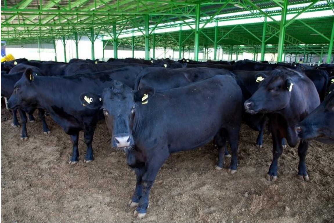
Avustralya'dan getirilen anguslar.

ulusal kırsal kalkınma planının kabul edilmesiyle bu alanda ilerleme kaydedilmiştir.