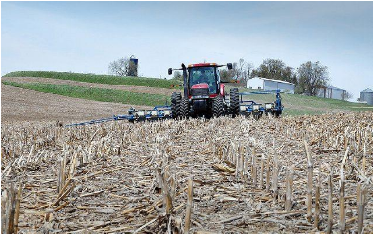
İleri tarım tekniđi.

Osmanlı İmparatorluđunda kullanılan timar sistemi 15. Yüzyılın ikinci yarısından itibaren gerilemeye başlamıř ve 16. Yüzyıl sonuna gelindiđinde devlet için üzerinden atması gereken bir yüke dönuřmüřtür. Sistemin tıkanma nedenleri ekonomik, askeri, teknolojik ve demografik kořullarda meydana gelen köklü deđişiklikler ve bu deđişikliklere Osmanlı İmparatorluđunun uyum sağlayamamıř olmasıdır. Ateřli silahların kullanılmaya başlanması ile süvari birlikleri önemini kaybetmiř, ekonomik açıdan fetihlerin sona ermesi nedeniyle kaynak sıkıntısı ortaya çıkmıř, teknolojik açıdan ise mevcut toprak rejiminin geri kalmayı adeta zorlayan niteliđine artan nüfusun bir kısmının üretim faaliyeti dıřında kalması eklenince timar sisteminin çöküřü kaçınılmaz olmuřtur.