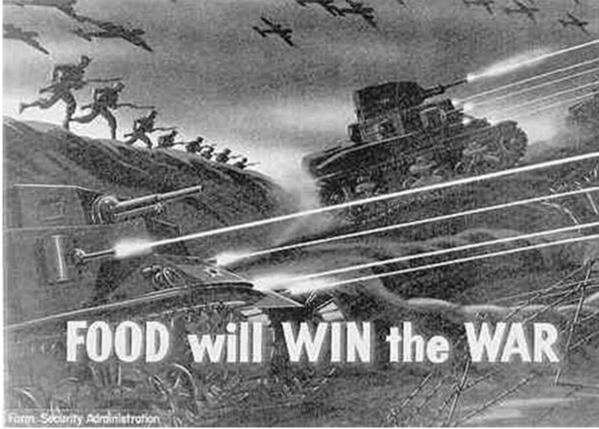
Besin savaşı kazanacaktır. İllüstrasyon: Air Group 4

Günümüz dünyasında toprağın öneminin azaldığı konusunda Steven SPIEGEL'in 3 görüşlerine katılmak pek mümkün görünmüyor. Aksine, insanın var oluşunda günümüze dek toprağa olan bağımlılığın önemini daha iyi kavradığına yönelik birçok işaretler mevcuttur.