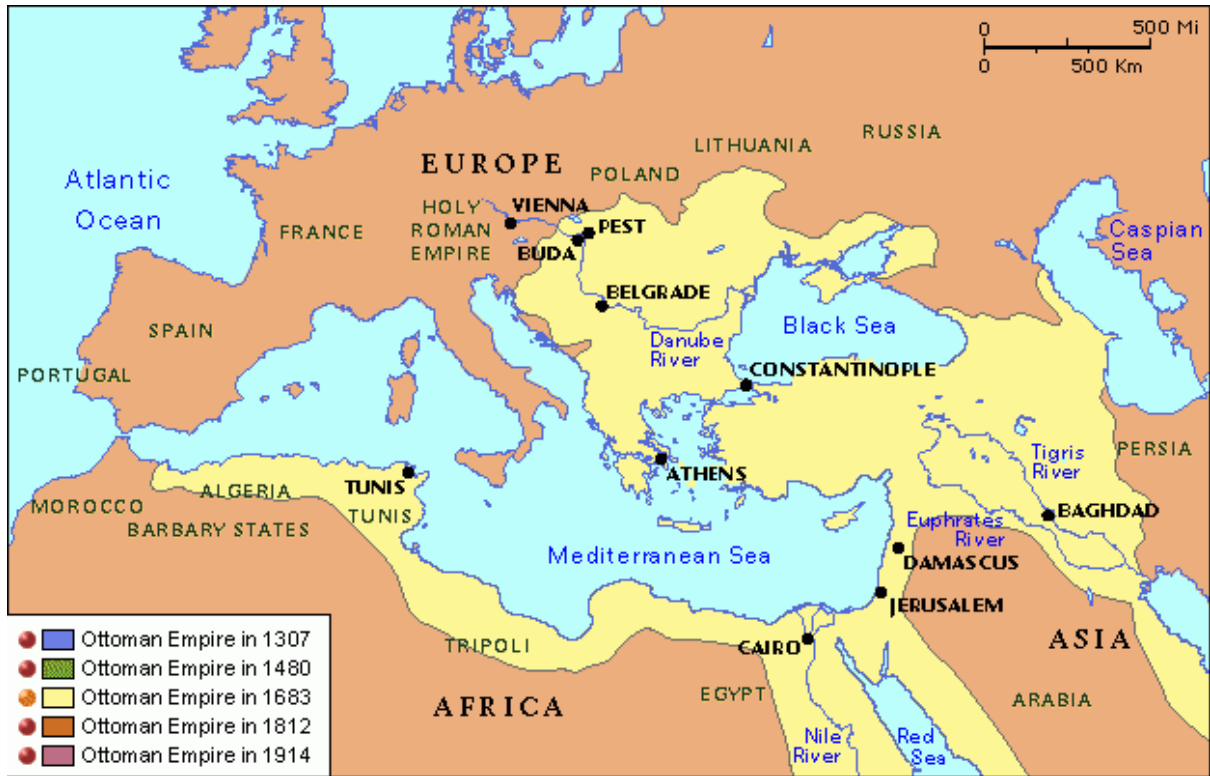
Osmanlı İmparatorluğu. Harita: Atlas

Bunu, sadrazam, vüzara, ümera, beylerbeyi, sancakbeyi ve askeri görevler için dirlik verilen sipahiler izlemektedir. 41