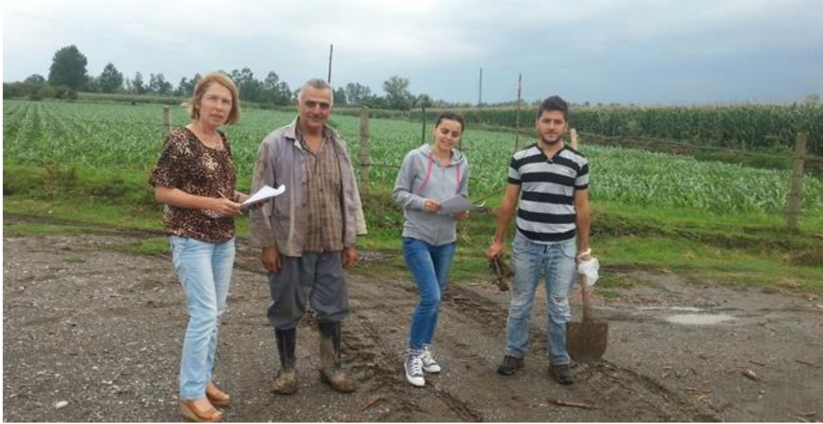
Çiftlik Muhasebe Veri Ağına kayıtlı çiftçiler.

ve keçi başına yapılan ödemelerle ilgili yönetmeliğin kabul edilmesi, mevcut OTP tedbirleriyle bir dereceye kadar uyum gerçekleştirilmesini sağlamıştır