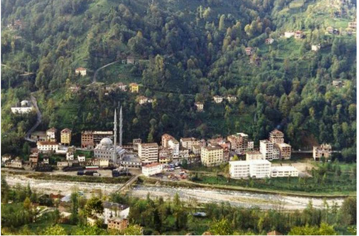
Erdoğan'ın yazlık bir evi olan Karadeniz yakınındaki Güneysu Kasabasının merkezi

Darbeden haftalar sonra, hiddetten burnundan soluyan Erdoğan; “Bazıları 10.000, 20.000 kişiyi işten attığımızı söylüyor. Kim olurlarsa olsunlar, on binlercesini tasfiye edeceğiz.” ifadelerini sarf ediyordu.