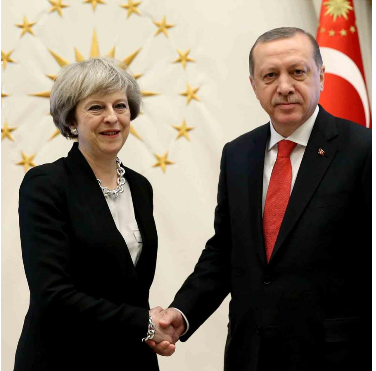
ABD Başkanı Trump ile görüşmesinin hemen sonrasında Erdoğan'a giden Theresa May.

Kiminle konuştuğunuza bağlı olarak; Türkiye bir yol ayrımında, ya da uçurumun kenarında ve hangi yöne gideceğine de tek bir adam karar verecek.