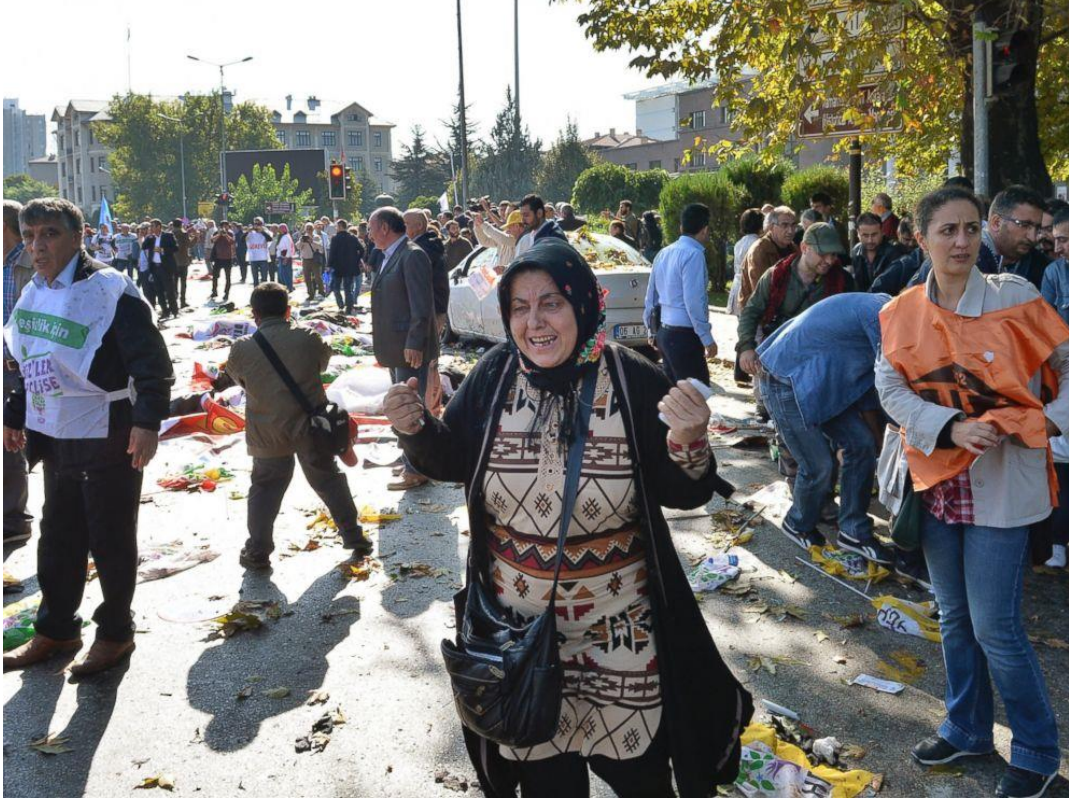
Patlama sonrasında bir kadının tepkisi. 10 Ekim 2015. Ankara.

bomba kendini patlatır. Ortalığın kan gölüne döndüğü patlamalarda 95 kişi hayatını kaybederken, 48'i ağır 246 kişi ise yaralanır. Patlamanın ardından ceset parçaları üç kilometrelik alana yayılır.